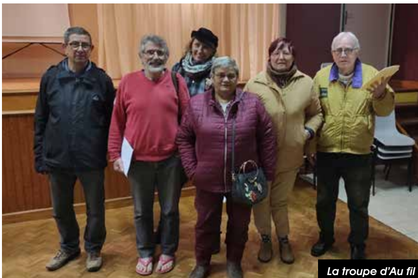
La troupe d'Au fil du Briou 2023

Autrefois, c'était avant les réfrigérateurs et les chambres froides, pour conserver le raisin le plus longtemps possible, il y avait plusieurs méthodes, comme par exemple, suspendre les grappes sur des fils, ou les mettre sur le grain, ou les déposer sur des clayettes garnies de fougères. Une partie d'entre elles résistait