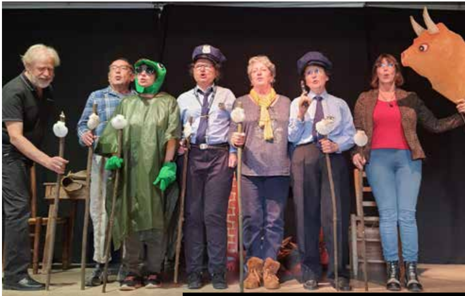
La troupe du Rideau Rouge de Saint-Jean d'Angély