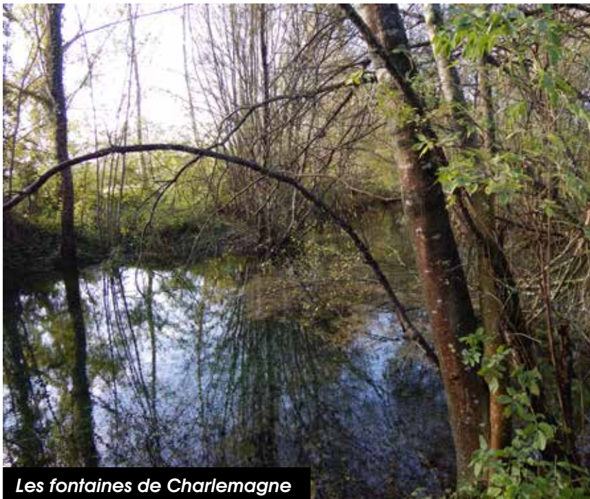
Les fontaines de Charlemagne

Une autre fois, à la chasse, il voulait tuer un lièvre mais ne sachant pas à quoi ressemblait cet animal, il interrogea un paysan qui passait par là. L'homme lui dit que l'animal en question avait la queue courte et de grandes oreilles. Fort de cette information, le seigneur reparti à la chasse et tua... un âne !