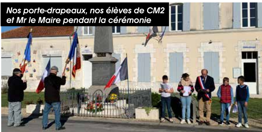
Nos porte-drapeaux, nos élèves de CM2 et Mr le Maire pendant la cérémonie

Les travaux sur le chemin de La Pinelle n'avaient pu démarrer dans les temps prévus étant donné que l'entreprise MARTIN avait été réquisitionnée cet été pour faire des pare-feux lors des incendies survenus dans la région bordelaise. A leur retour, l'interdiction d'arroser les routes, par arrêté préfectoral, a également repoussé l'ouverture du chantier. Les travaux ont enfin pu débuter le 25 octobre par le fraisage de la route et la pose d'une couche de calcaire suivie de l'arrosage et du passage d'un cylindre pour la mise en forme. Malheureusement, le samedi 5 novembre, il a fallu tout stopper, un trou ayant apparu juste après le bois situé au Plantis. Cette ouverture de 70 cm de diamètre laissait apparaître une cavité dont on ne voyait pas l'extrémité. Le 8 novembre l'entreprise Martin est venue avec une pelle afin de voir l'étendue des dégâts. Finalement, il ne s'agissait probablement que d'une salle qui aurait servi à l'extraction de pierres, mais à cette occasion, nous nous sommes rendu compte que la partie du chemin située entre Haimps et le bois de Massac n'avait aucune structure ce qui le rend peu sûr et sujet à des mouvements de terrain.