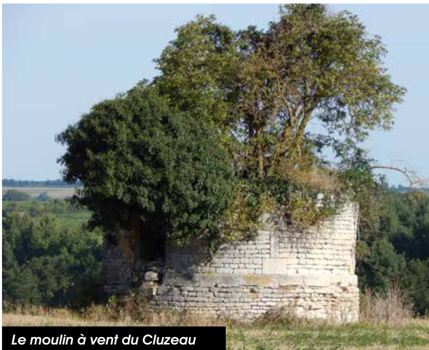
Le moulin à vent du Cluzeau

Si ces légendes vous amusent et vous intéressent, précipitez-vous à la mairie ou à la bibliothèque où vous trouverez les précieux recueils où sont rassemblés les récits minutieusement collectés et retranscrits par des gardiens du souvenir.