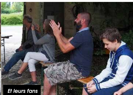
Et leurs fans