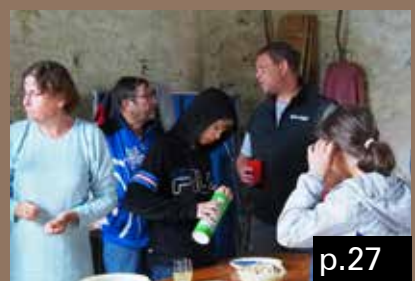
Les fêtes des voisins