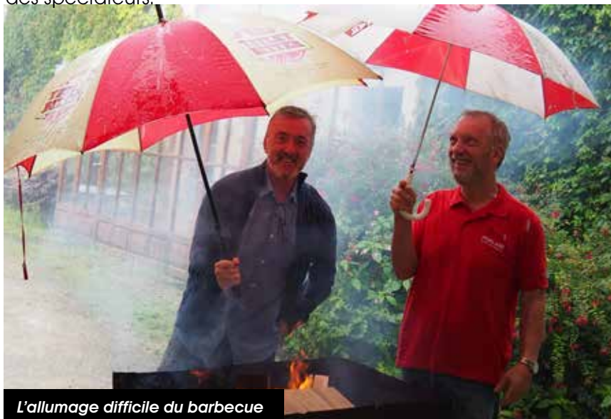
L'allumage difficile du barbecue

Les champions ont donné le maximum, sous l'œil admiratif des spectateurs.