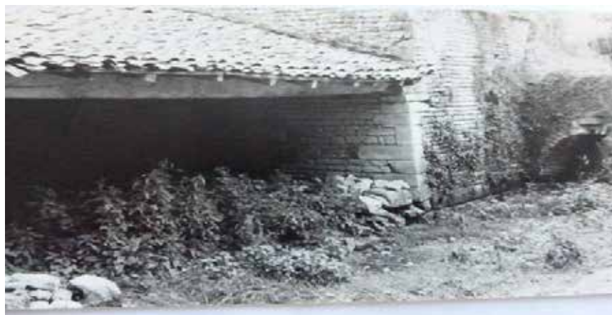
Un ancien lavoir à Fresneau (bief du Briou) – photo prise en 1988