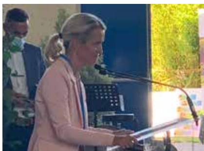
La présidente du département

Avant l'inauguration officielle du salon se tient l'assemblée générale de l'Association des Maires et des Présidents d'EPCI de la Charente-Maritime. Cette association départementale regroupe 463 communes, 13 EPCI et 1 Pays. Elle propose une assistance juridique auprès des collectivités adhérentes et met en place un programme de formation des