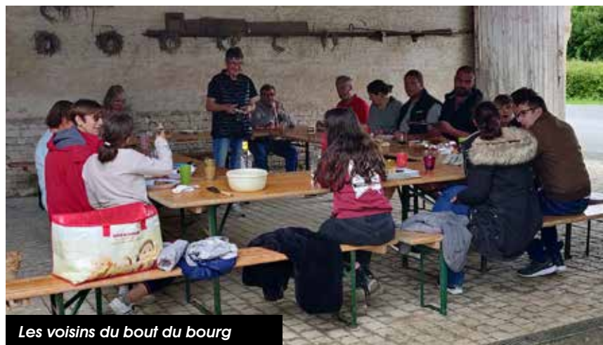
Les voisins du bout du bourg