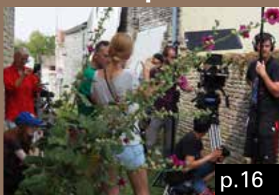
La culture est partout !