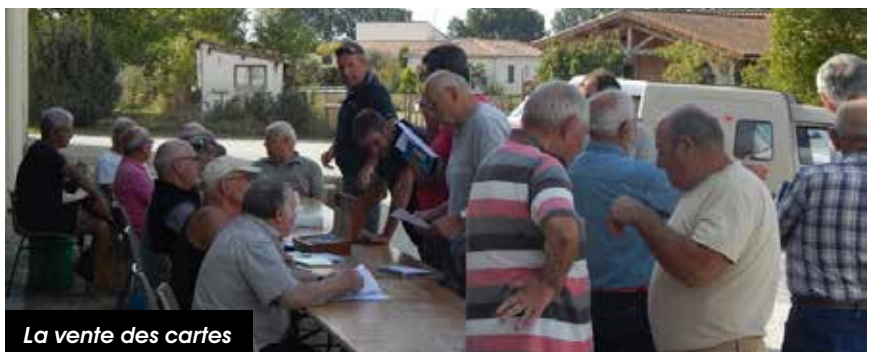
La vente des cartes

Le samedi 4 septembre, plusieurs équipes se sont formées pour faire le tour des réserves, vérifier les pancartes ou remplacer les manquantes. Courant août, 340 perdreaux ont été lâchés dans différents points du territoire, et bientôt ce sera une