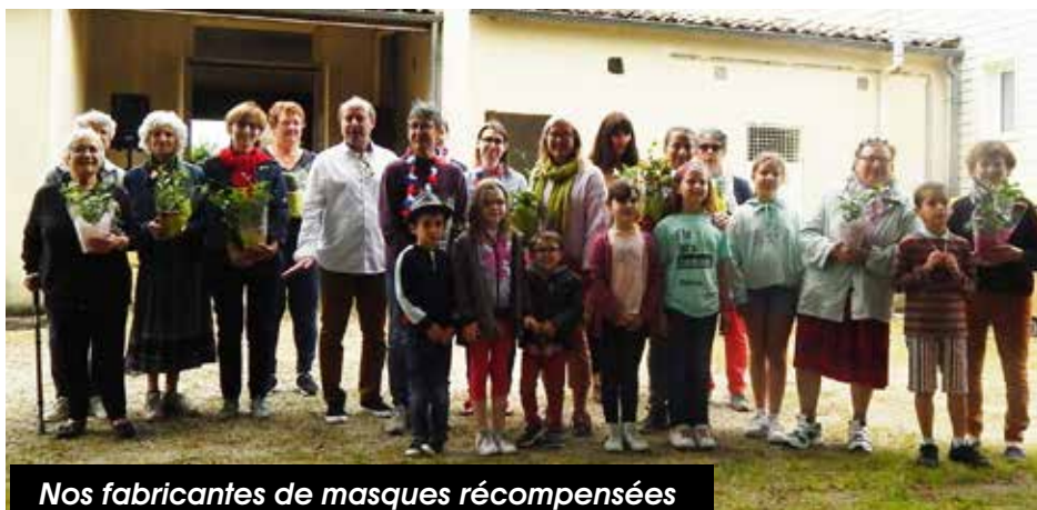
Nos fabricantes de masques récompensées