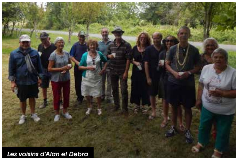
Les voisins d'Alan et Debra