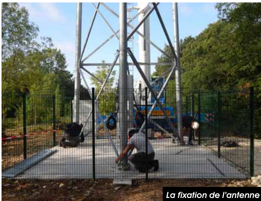
La fixation de l'antenne