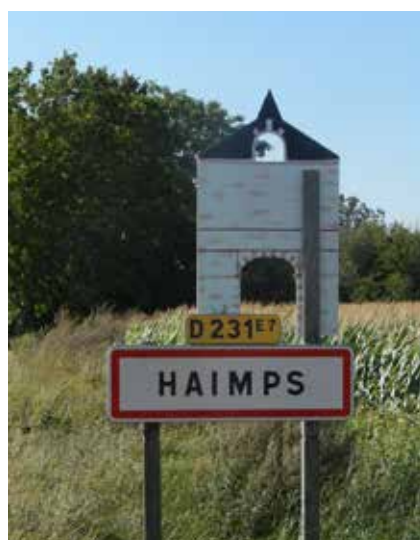
Route des Touches