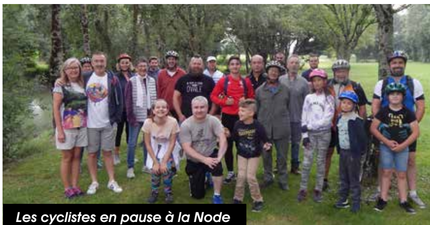
Les cyclistes en pause à la Node