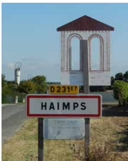
Route de la Gare